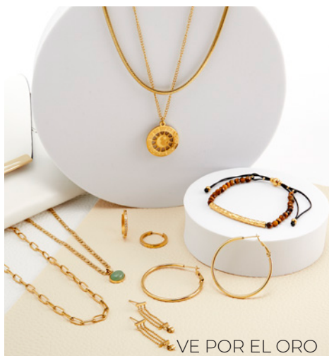
VE POR EL ORO

Comienza hoy por sólo $1 & ¡gana tu selección de Kit Elite GRATIS!*