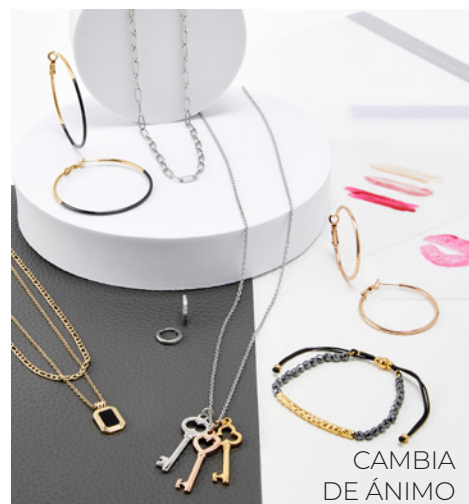
CAMBIA DE ÁNIMO

Productos incluidos: Aros Riley, Brazaletes Kai, Collares Olivia, Cassandra y Katrina, Pendientes Vanessa y Paragon.